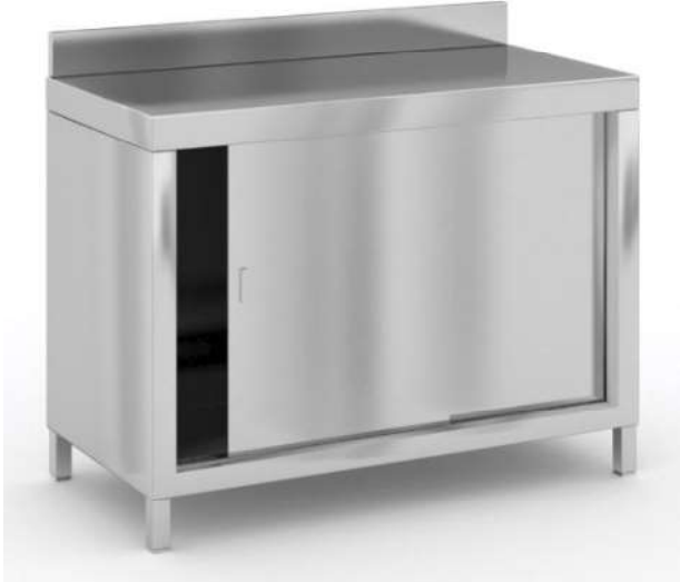
N2 – 1 ks – 1200x600x850 mm m. č. 552